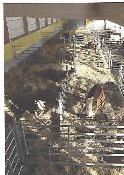
Stallet är öppet och luftigt och har väl tilltagna ytor för djuren.